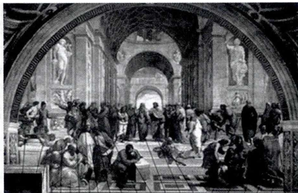
1 2 3 4 5 6 7 8 9 10 11 12 13 14 15 16 17 18 19 20 21 22 雅典学院

在阅读教科书中《雅典学院》的文字介绍过程中,我们不禁要问:这幅世界名画是谁在什么时间绘制的?画中的“许多雅典先贤”和“一些当时的人物”分别是谁?