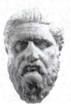
柏拉图 (公元前427—前347年)

教师多媒体展示放大的“雅典学院”插图,指出“14”和“19”为“柏拉图”和“拉斐尔”,制作时间轴,将两者置于轴中,引导学生思考问题: