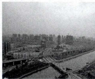
六安市淠河沿岸风光（2014年）

同学们，请仔细观察下列两幅图片，用一个词概括出你对15世纪（相当于中国明朝）时意大利佛罗伦萨的第一印象？（学生回答“密集”“繁华”等）