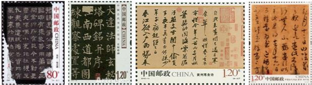
A B C D