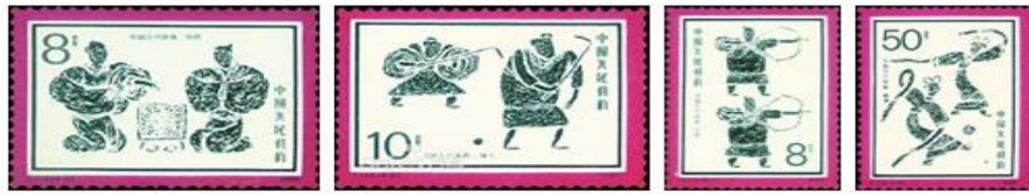
①（围棋） ②（捶丸—球类竞技） ③（弓箭） ④（蹴鞠）