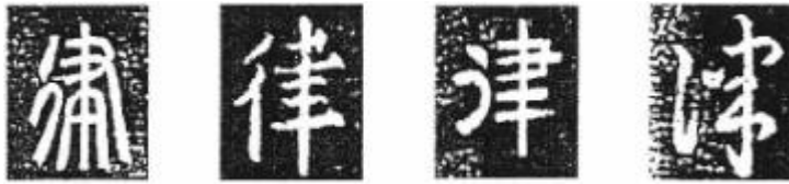
A B C D