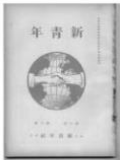
图2 1920年《新青年》第8卷第1号封面