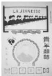
图1 1915年《青年杂志》创刊号封面