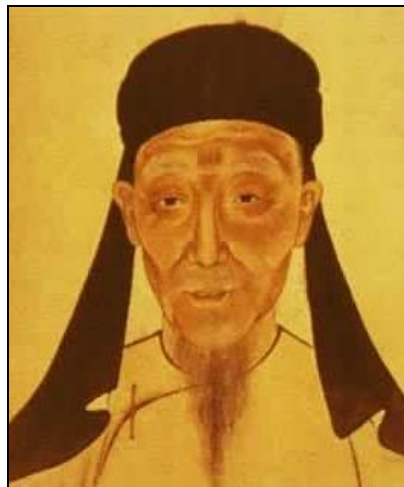
黄宗羲 梨洲先生 明末清初 (1610-1695)