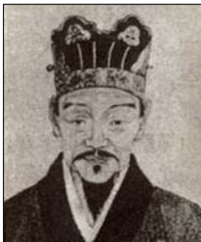
李贽 温陵居士 明后 (1527-1602)