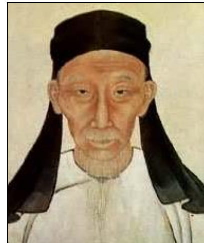
王夫之 船山先生 明末清初 (1619-1692)