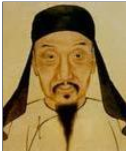
顾炎武 亭林先生 明末清初 (1613-1682)