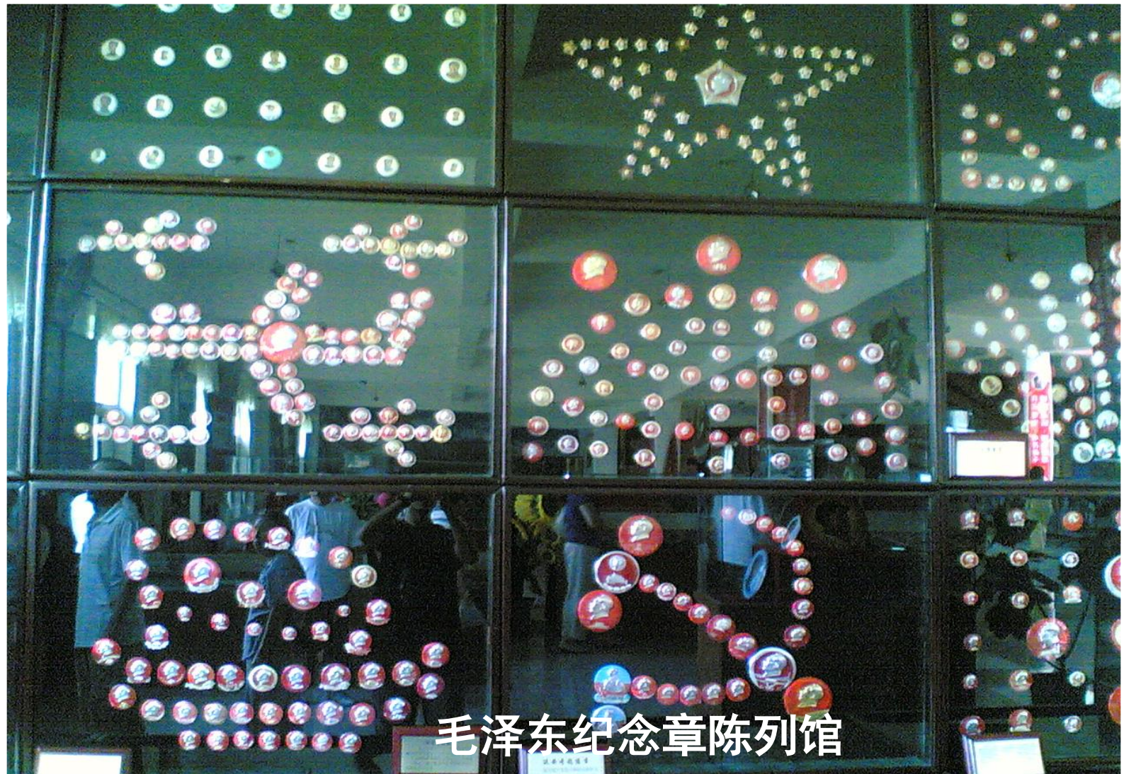
毛泽东纪念章陈列馆