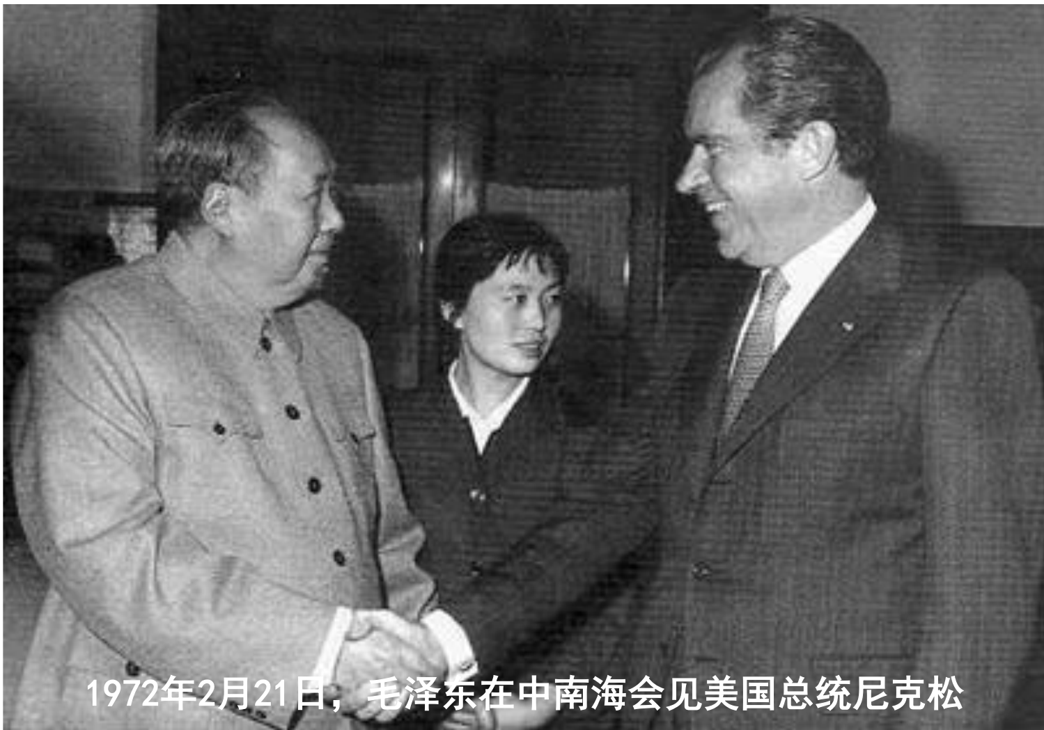
1972年2月21日，毛泽东在中南海会见美国总统尼克松