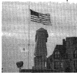
被“斩首”的哥伦布雕像

12.1792 年，美国设立哥伦布日以纪念新大陆的发现。2020 年 6 月，美国波士顿街头却出现下图中的情景。这表明