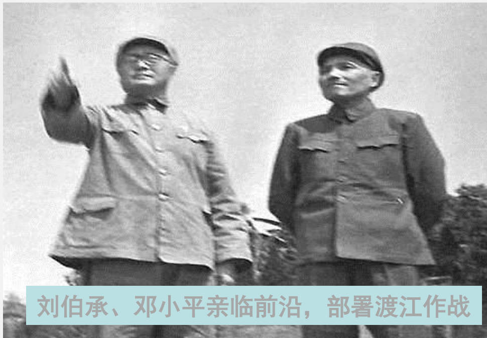
刘伯承、邓小平亲临前沿，部署渡江作战