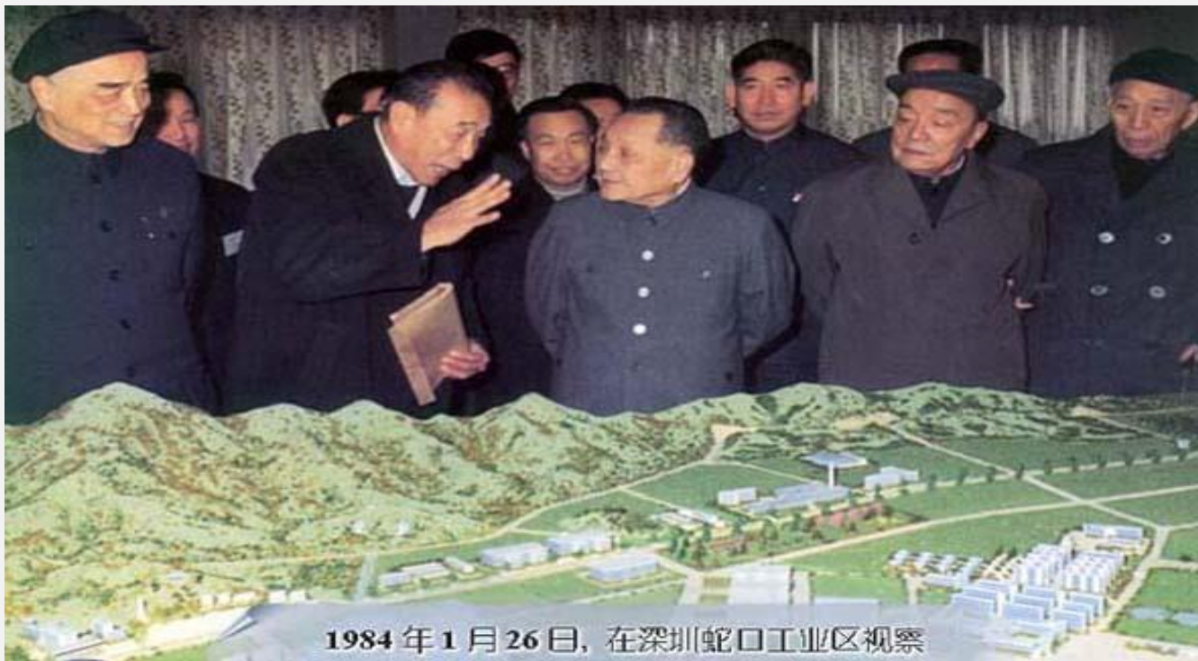
1984年1月26日，在深圳蛇口工业区视察