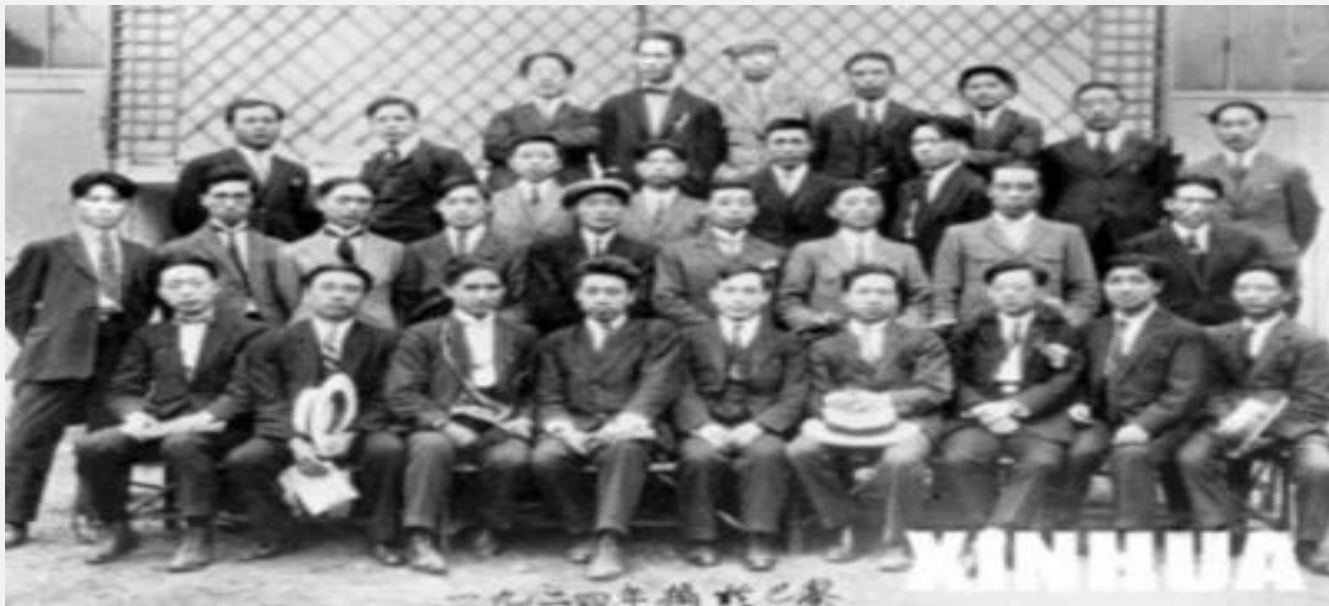
1924年，中国社会主义青年团旅欧支部部分成员在巴黎合影