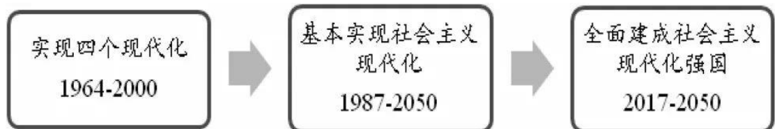
图 2 共和国现代化历程

共和国史是中国共产党人聚焦民族复兴、迈向现代化（如图 2）的艰辛探索史。将共和国 70 多年的发展史放置在二战后国际关系的世界视角下，在世界之林构建一个新中国的形象，抒写马克思主义为什么“行”。