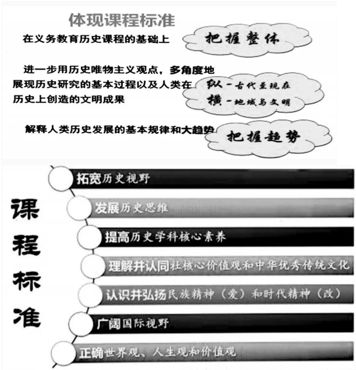
图3 课程标准贯通“大趋势、世界性”意识图示

从潮流性的视角把握党史符合时代潮流的特征。《纲要（下）》第16课第一次国共合作及北伐战争正处于亚非拉民族民主运动潮流中。将这一时期客观的历史事实置于第一次世界大战后世界反帝反殖运动的高潮中讲述，透过潮流趋势分析中国共产党在国民大革命中的历史作为，就能使学生轻松获得这些史事的世界性意义。